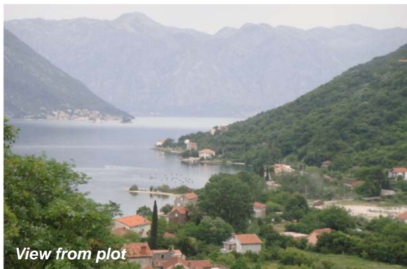
View from plot