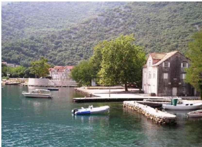
SEA FRONT AT MORINJ