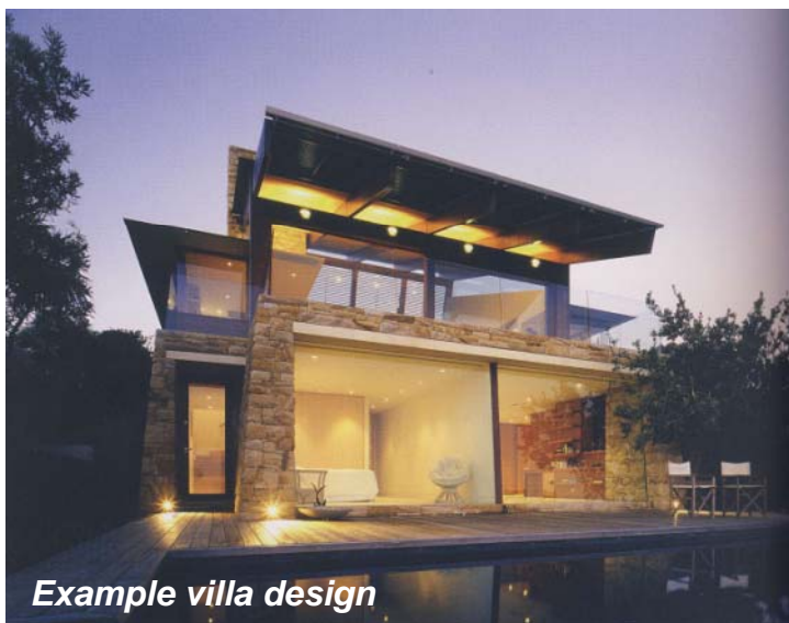
Example villa design